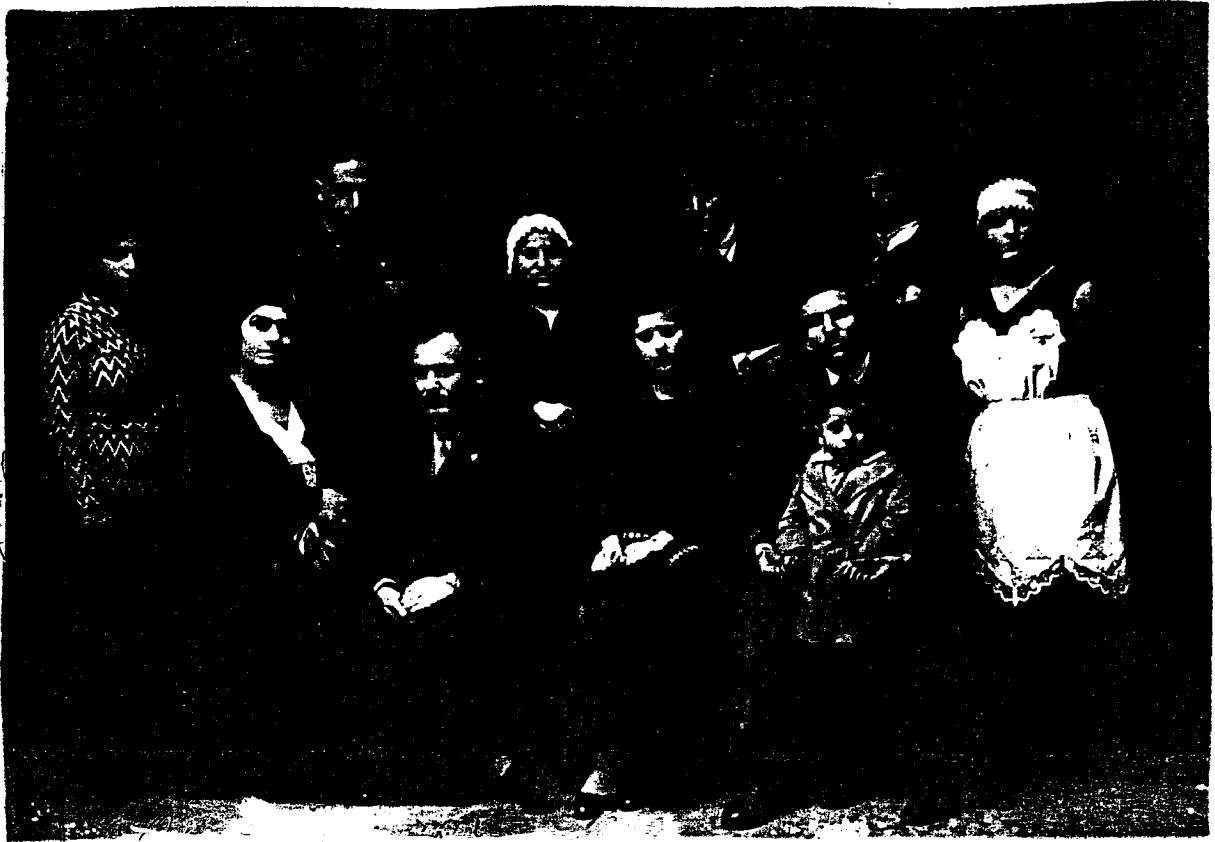
Θεατρική παράσταση " Οι 'Ατιμοι". 1932