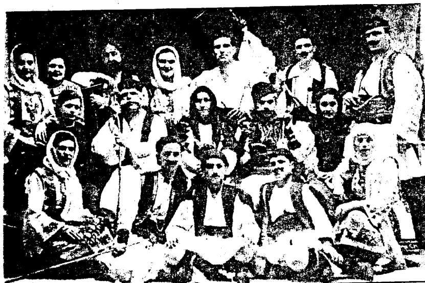
Β' Δημ. Σχολ. 21-1-1939. Θεατρική παράσταση " Ο Αγαπητικός της Βουκοπούλας "