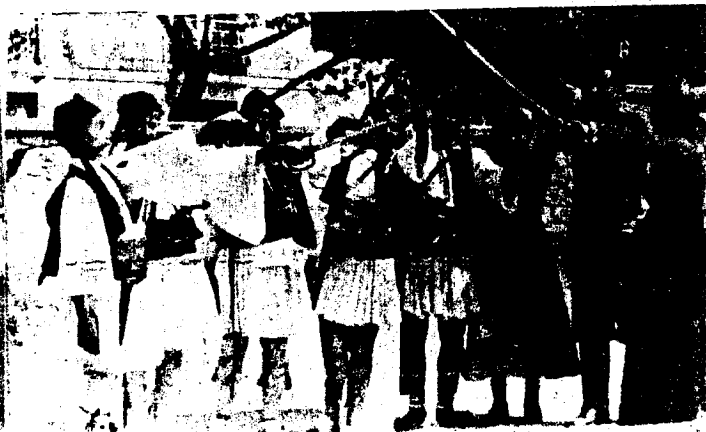
ΘΕΑΤΡΙΚΗ ΠΑΡΑΣΤΑΣΗ 1930 Γ' ΔΗΜΟΤΙΚΟΥ