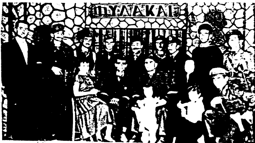
1938. Θεατρική παράσταση στο Α' Δημοτικό Σχολείο.