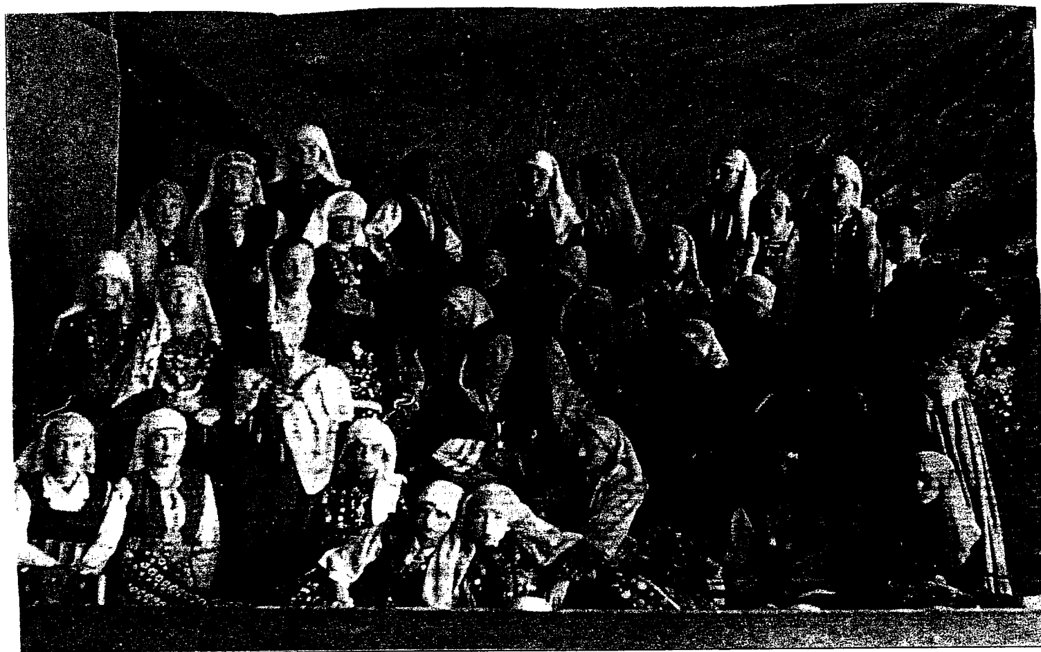
Ο Χορός του έργου «Αντιγόνη». Παράσταση το 1936 από το Γυμνάσιο Σουφλίου.