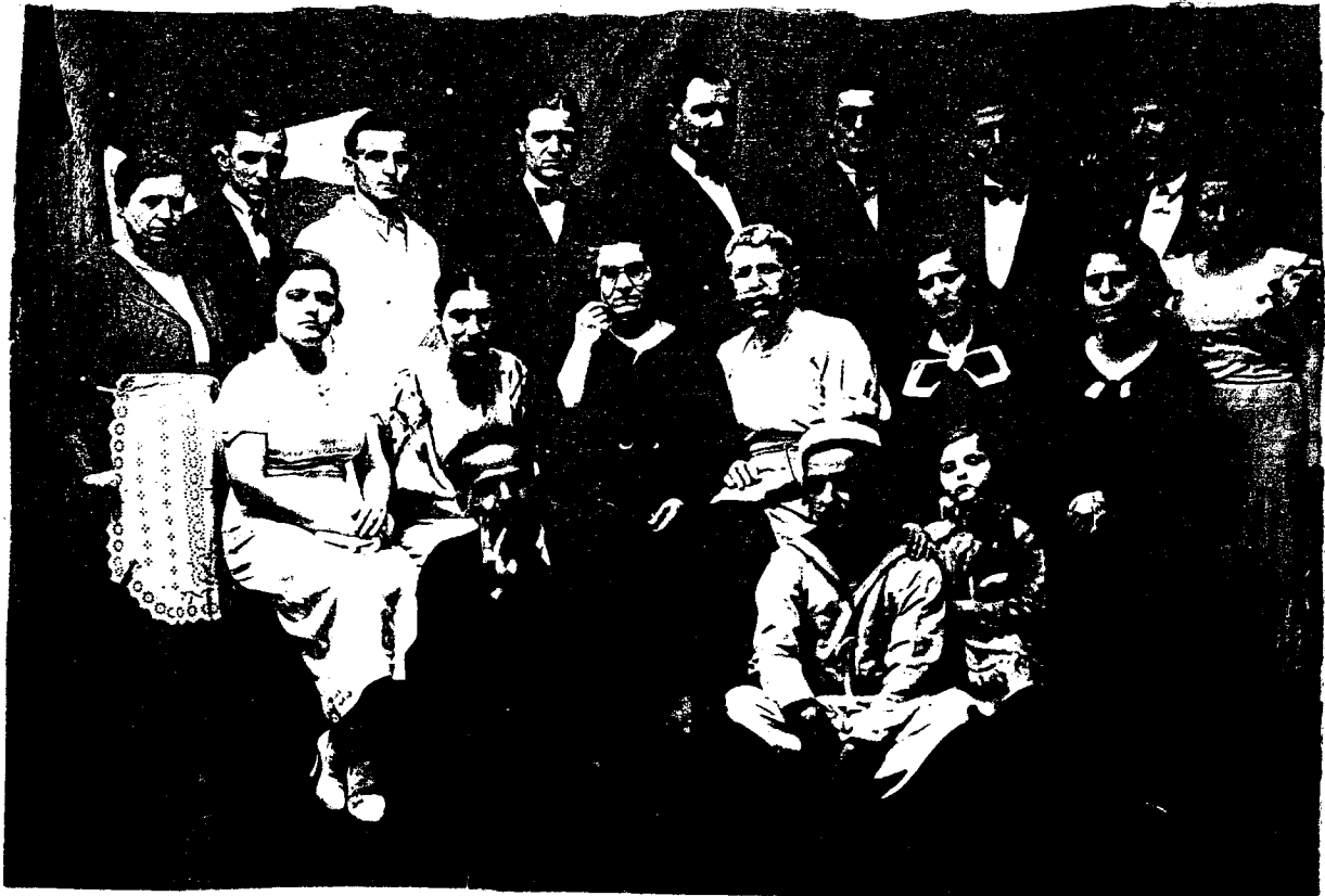
Το προσωπικό του Β: Δημ. Σχολείου στη Θεατρική παράσταση " Ο Ημπαός εκπαιδεύεται " του Μελά