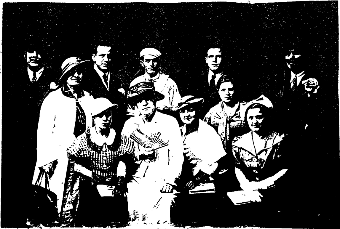
Θεατρική παράσταση " Η Θεία του Καρόλου" 1937