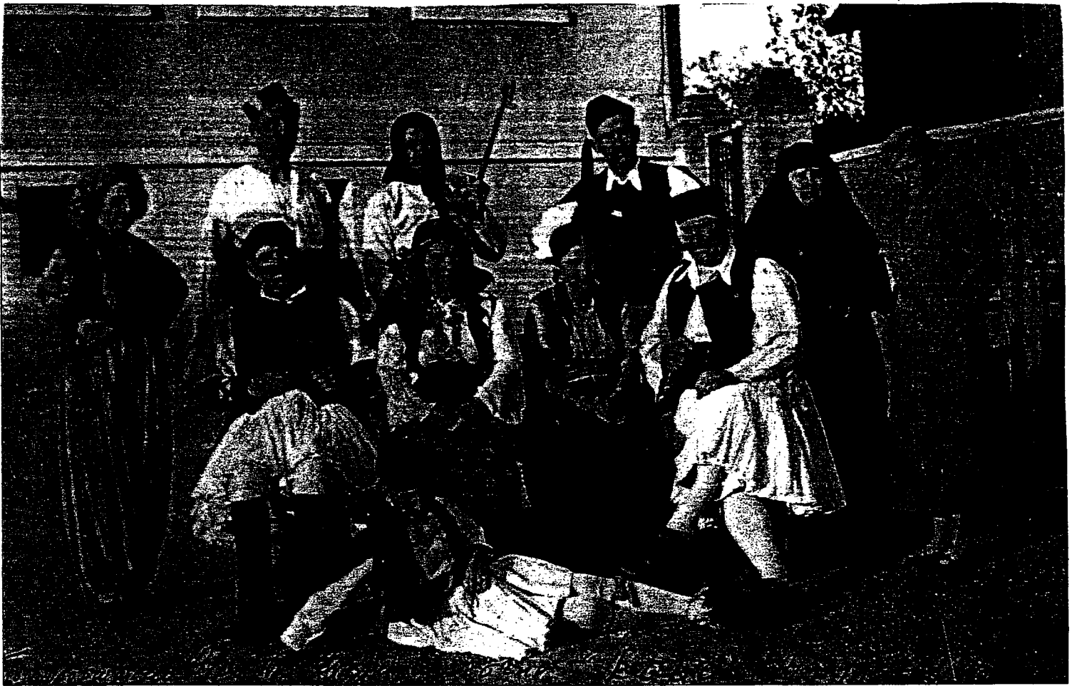
Ερασιτεχνική Θεατρική παράσταση. Έργο «Εσμέ» 24 - 11 - 1936.