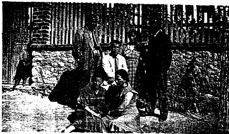
Ο Δ/ντής και το προσωπικό του Β΄ Δημ. Σχολείου τη σχολική χρονιά 1933-1934