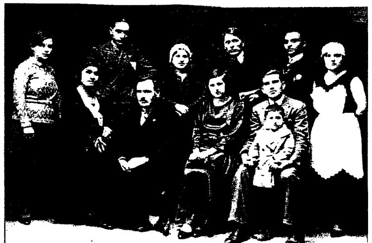
Ερασιτεχνική Θεατρική παράσταση. Έργο «Ο μπαμπάς εκπαιδεύεται».