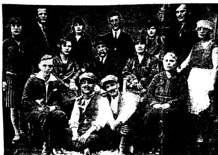
Ερασιτεχνική Θεατρική παράσταση. Έργο «Ηλύρα του Γερωνικόλα».