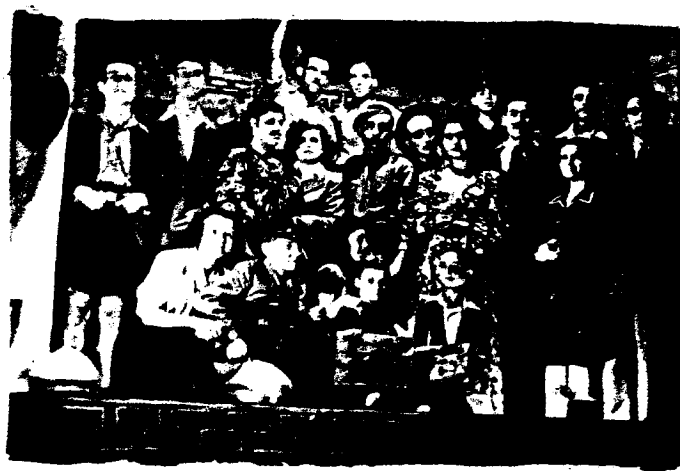
1949. Θεατρική παράσταση από τον Όμιλο Ανεμοπόρων.