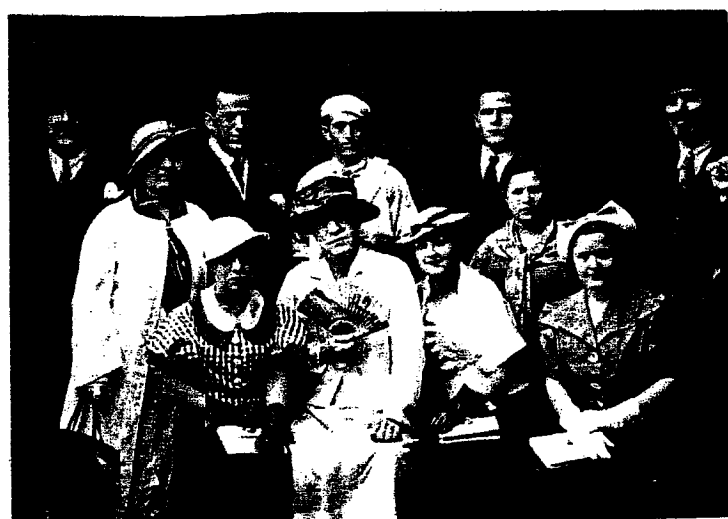
Ερασιτεχνική Θεατρική παράσταση. Έργο «Η Θεία του Καρόλου».