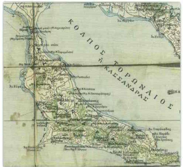
Ἡ χερσόνησος τῆς Κασσάνδρας κατά τό 1910· μέ κόκκινα βέλη σημειώνονται τὰ σιμωνοπετρίτικα μετόχια.

Στή Βάλτα τῆς Κασσάνδρας ἡ Ἱ. Μ. Σιμωνόπετρας διατηροῦσε μικρό κτῆμα ἤδη ἀπό τό 1660, τό ὅποιο ὑπαγόταν ἀρχικά σέ ἓνα ἄλλο σημαντικό μετόχι τῆς, πού βρι-