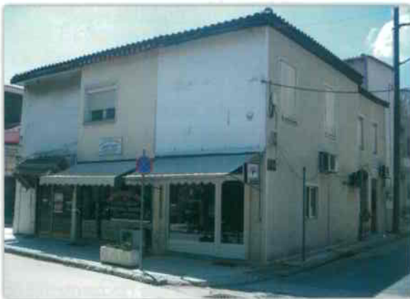
Η οίκία τοῦ παπα-Σταμάτη σήμερα

έχει ως άποδέκτη τόν τότε Καθηγούμενο τής Ι. Μ. Σίμωνος Πέτρας Αρχιμανδρίτη Ιερώνυμο (1920-1931), τόν όποιο γνώριζε πριν γίνει ήγούμενος, από τίς άποστολές του στα δύο μετόχια τής Κασσάνδρας, αλλά δέν τόν συνάντησε μετά τήν έκλογή του τό 1920. Όπως προκύπτει από τά Αρχεία τής Μονής (κατηγορία Γ3), ο Ιερώνυμος τό 1919 πραγματοποιούσε έξαρχικές άποστολές (οικονομικό έλεγχο τών οικονόμων, έξακρίβωση άναγκών, κ.λπ.) στα σιμωνοπετρίτικα μετόχια τής Χαλκιδικής και έμεινε γιά ένα διάστημα στό «Πετριώτικο» Κασσάνδρας. Κατά τόν Αύγουστο τοῦ 1919 έπισκέφθηκε και τό «Κελλί» τής Βάλτας γιά νά πάρει τά οικονομικά στοιχεία του από τόν οικονόμο Δαμασκηνό.