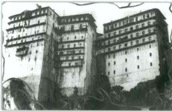
Ἡ Σιμωνόπετρα τήν ἐποχή πού τήν ἐπισκέφτηκε ὁ παπα-Σταμάτης.

τίς σημαντικότερες πνευματικές φυσιογνωμίες πού ἀνέδειξε τό Ἅγιον Ὄρος τόν 20ό αἰῶνα· ἄνθρωπος μέ ἀγιότητα βίου καί ἀνεκτίμητη προσφορά στήν Ἐκκλησία. Μετά τήν ἀναγκαστική ἀναχώρησή του ἀπό τό Ἅγιον Ὄρος τό 1931, ἔζησε τό ὑπόλοιπο τῆς ζωῆς του στό σιμωνοπετρίτικο μετόχι τῆς Ἀναλήψεως στόν Βύρωνα Ἀττικῆς. Ἐκεῖ ἀναδείχθηκε σέ πνευματικό καθοδηγητή χιλιάδων πιστῶν, κοσμούμενος μέ κάθε εἶδος ἀρετῆς, καθώς καί μέ τά σπάνια χαρίσματα τῆς διοράσεως, τῆς προοράσεως καί τῆς ἰάσεως τῶν ἀσθενειῶν. Ἦδη ὡς μοναχός διατηροῦσε στενό πνευματικό σύνδεσμο μέ τόν ἅγιο Νεκτάριο, μαζί μέ τόν ὁποῖο ἔδωσαν μία νέα πνοή στόν γυναικεῖο μοναχισμό τῆς Ἑλλάδας.